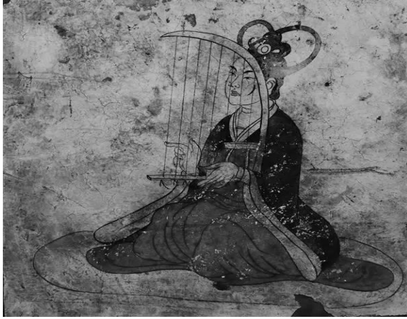
Vey Quyçjen (b.e. 597-665 illər) sərdabəsində tapılmış Kunxou