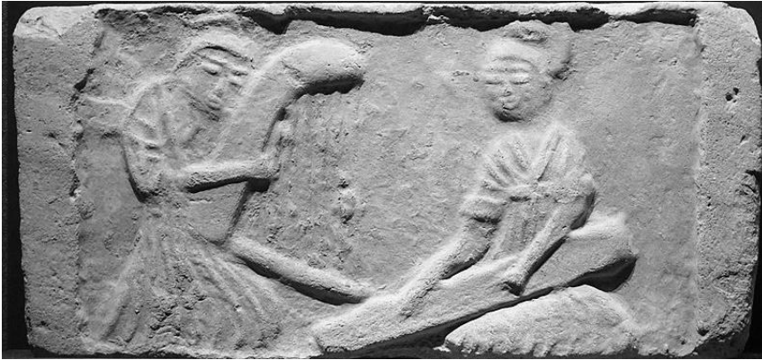
Tzyusüan şəhərindən Kunxou və Qutsin. Tan sülaləsi (b.e. 618-907 illər) Qansu əyalətinin muzeyindən

Orqanoloji tədqiqatlarda miqrasiya probleminə, qeyd edildiyi kimi həmçinin K.Zaksın [7] monoqrafiyasında da toxunulub. Bu sıraya ərəb musiqisinin tədqiqində tarixi əlaqələr məsələləri işıqlandırmış Q.Farmer [8], X.Xikmannın [9] adını əlavə etmək də lazımdır. Bizim tədqiqat işimizdə, musiqi alətlərinin miqrasiya məsələlərinə toxunan bu qismdən olan araşdırmalar müəyyən maraq kəsb edir.